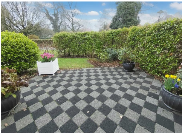
Terrasse mit pflanzlichem Wind- und Sichtschutz