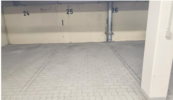
Stellplatz Nr. 25