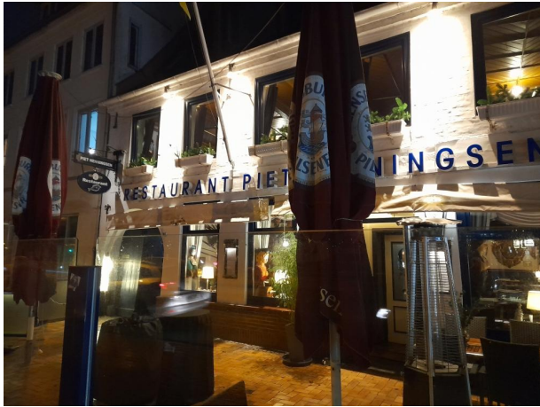
RESTAURANT "PIET HENNINGSEN"