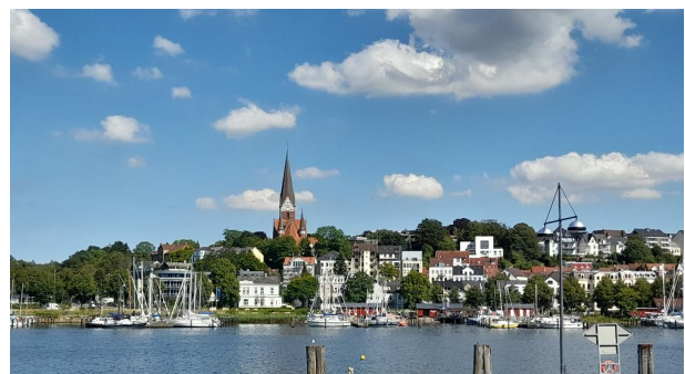
Blick vom Gebäude