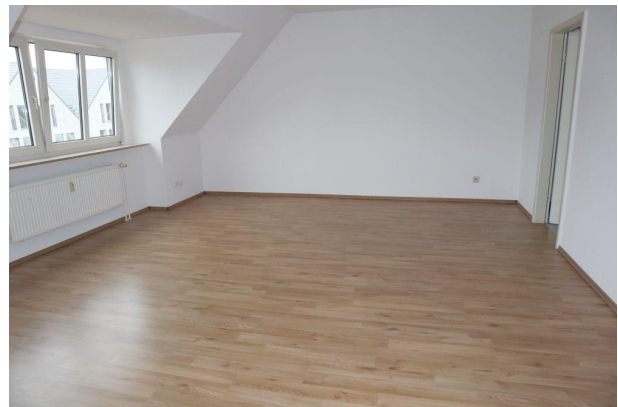
Schlafzimmer weitere Ansicht