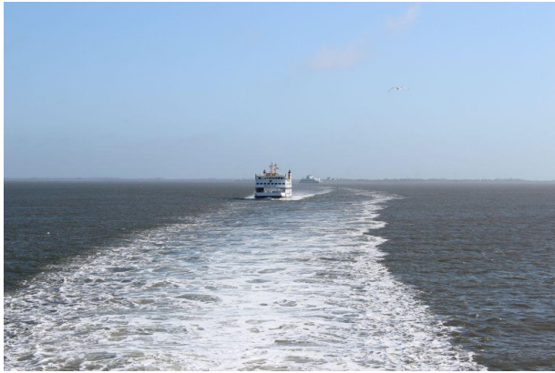
Auf der Schiffsfahrt nach Föhr